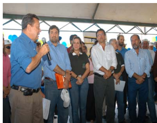
Ministro da Agricultura: Roberto Rodrigues

Outro ponto forte é o público, onde produtores rurais, técnicos e estudantes formaram a grande maioria dos visitantes, os quais tiveram acesso as novas tecnologias por meio de palestras técnicas e temáticas, clínicas tecnológicas, visitas às unidades demonstrativas no campo, expodinâmicas e mostra de produtos e serviços, através das 187 empresas públicas e privadas, que estiveram presentes na Agrotins 2005.