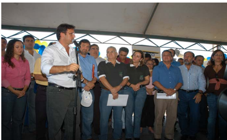
Abertura Oficial: Governador - Marcelo de Carvalho Miranda

Hoje os todos segmentos da sociedade já se integram a este projeto, os avanços puderam ser sentidos a cada edição da Feira e a parceria com instituições do setor público e privado, continua sendo um dos pontos fortes do evento, considerada de fundamental importância para o fortalecimento e a continuidade das atividades desenvolvidas.