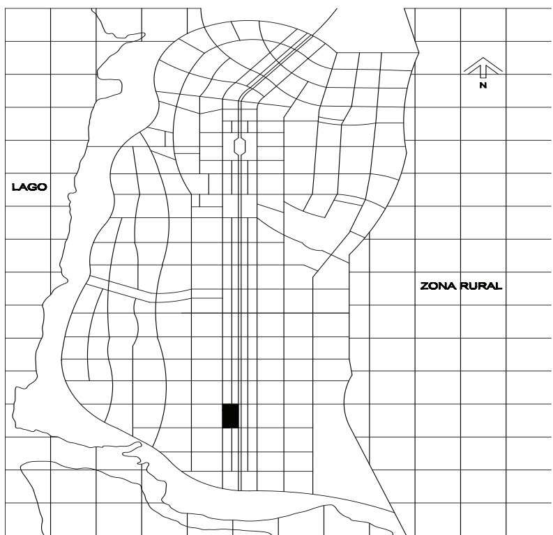
Planta de Localização ACSUSO 130