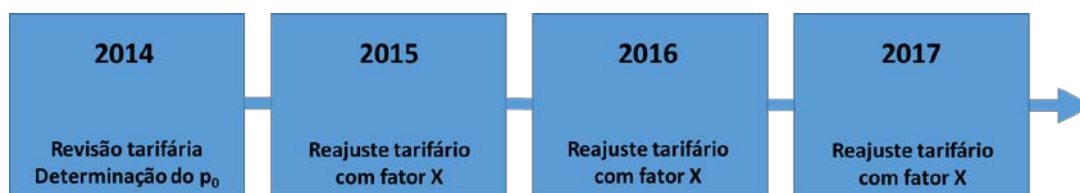
Diagrama – 1º Ciclo Tarifário da Foz | Saneatins

Ao longo do ciclo tarifário, durante os anos de 2014 a 2017, o preço nominal será atualizado anualmente pela taxa de inflação. Adicionalmente, como é próprio do regime regulatório de preçoteto, o preço será ajustado por um fator de produtividade (“Fator X”). O esquema a seguir ilustra os fatos ordinários previstos para o primeiro ciclo de Revisão Tarifária da Foz|Saneatins 1 .