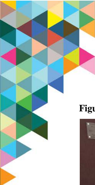
Figura 02. Recuperação da calçada