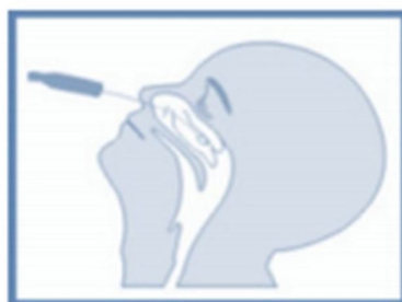
A – Swab nasal.