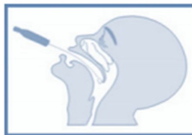
B – Swab oral.