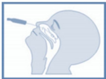
A – Swab nasal.