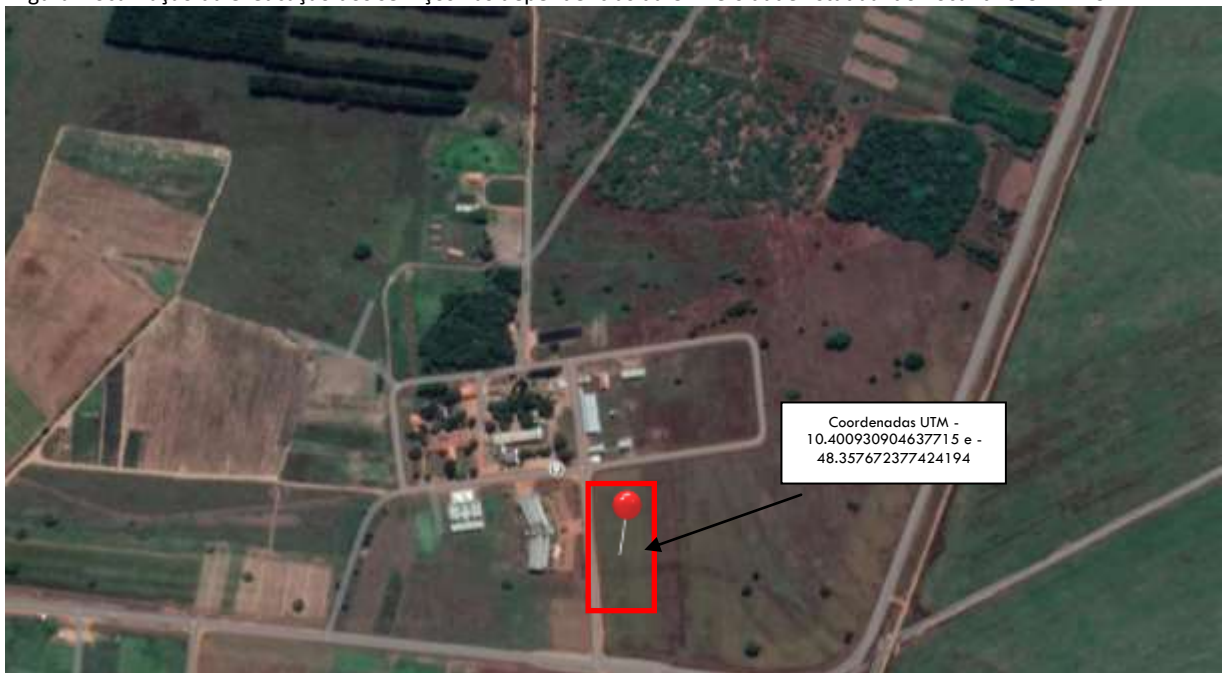
Figura. Localização da execução dos serviços nas dependências da Universidade Estadual do Tocantins-UNITINS.

3.2 A Figura a seguir apresenta a localização geográfica nas coordenadas UTM -10.400930904637715 e -48.357672377424194.